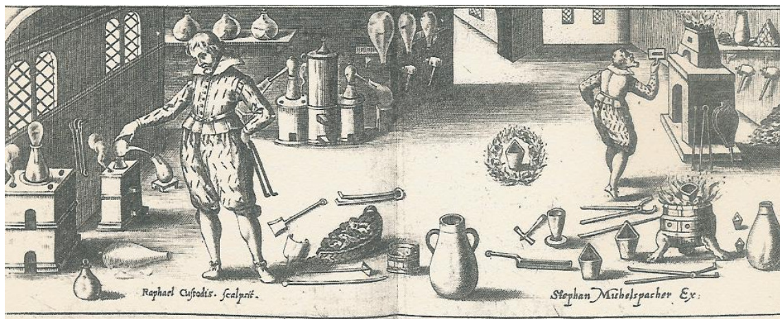
Abb.3. Ausschnitt aus dem vor Raphael Custodis angefertigten Kupferstich I aus Stephan Michelspacher „CABALA, SPIGEL DER KUNST VND NATVR: IN ALCHYMIA, Augspurg 1616. Auf der linken Seite erkennt man die Destillationsapparaturen zur Herstellung und Durchführung der „Scheidung auf dem nassen Weg“, also der Gold-Silber-Trennung mit Hilfe von Scheidewasser. Der rechte Laborant bevorzugt den trocken Weg der Scheidekunst. Er betrachtet durch ein geschlitztes Brettchen die Vorgänge, die im Probierofen in den Tiegeln ablaufen. Im Vordergrund (neben dem Hammer) ist ein Gießpuckel zu erkennen.

bildet sich im Glas „ein güldener Ring“. Das so erhaltene Gold wird mit Quecksilber legiert. 22 Agricolas Kommentar: „... so hält man dafür, das das Gold wieder IN PRIMAM MATERIAM gebracht sei, ich kann es nicht glauben, denn das Gold ist allererst IN SECUNDAM MATERIAM gebracht.“ 23