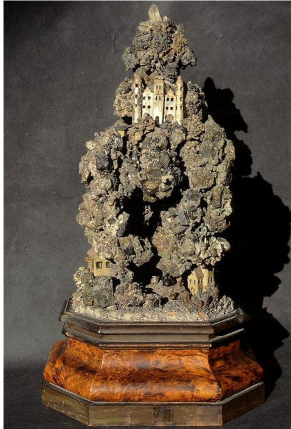
Abb. 2. Handstein aus dem Neukloster Wr. Neustadt: http://www.kunstkammer.at/stifte.htm

von Bergwerksmodellen. In die als Schaustücke dienenden Handsteine wurden häufig szenische Darstellungen des Bergbaus (Abschlagen der Erze, Abtransport in Hunten etc.) eingefügt, wobei die Figürchen häufig aus Silber, Elfenbein oder Koralle gefertigt wurden. Handsteine waren als Geschenke an hochstehende Persönlichkeiten zu Zeiten Rudolfs II. sehr beliebt. Wie wir aus Inventaren der kaiserlichen Sammlung wissen, befanden sich seltene böhmische Erze, die zur Herstellung solcher „bergwerke“ dienten, im sogenannten „gewölbten Raum des Alten Bern“ im Erdgeschoß des Gangbaues auf dem Hradschin.