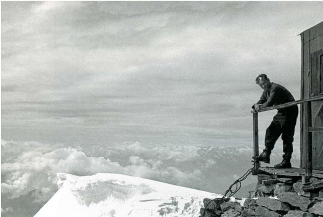
Primo Levi im Jahre 1960 vor der Capanna Regina Margherita am Monte Rosa in 4554 m. https://www.xmountain.it/ferro-primo-levi-sandro-dalmastro.html (25.7.2020)

Geruch wahr, der anderswo selten zu spüren ist. Soweit es mich betrifft, sollte ich ihn den Geruch des erreichten Friedens nennen". 17